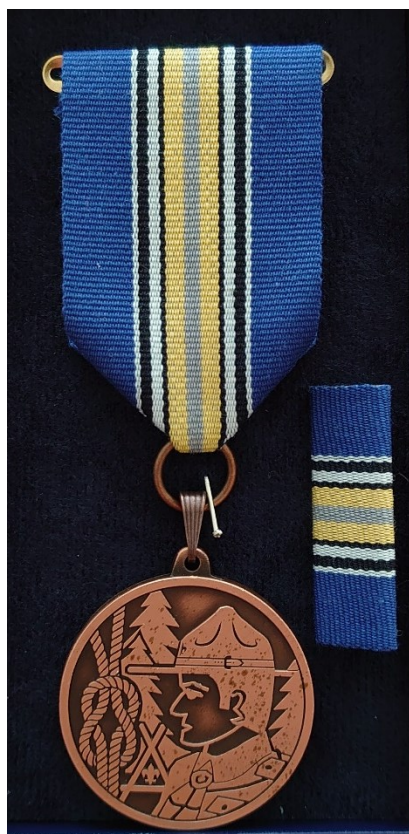
1. stupeň bronz

Fotografie jednotlivých stupňů vyznamenání.