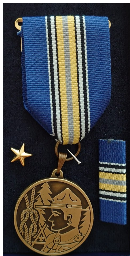
3. stupeň zlato