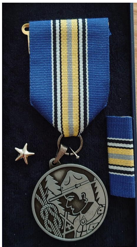
2. stupeň stříbro