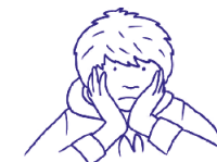
JAK NAKLÁDÁME S FRUSTRAČÍ