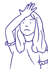
JAK ZVLÁDÁME CHYBY