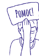
JAK SI UMÍME ŘÍCT O POMOC

Nezapomeňte, že holky a kluci nás neustále sledují, učí se nápodobou, my jsme jejich vzory. Pokud si o pomoc umím říct já, uvidí to a převzou způsoby, jak si mohou říct o pomoc sami. Další infografiky si můžeš stáhnout tady → skaut.cz/kodex/infografiky a použít je třeba v klubovně.