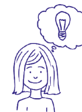
JAK ŘEŠÍME PROBLÉMY