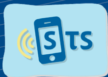
Skautská telefonní síť (STS)