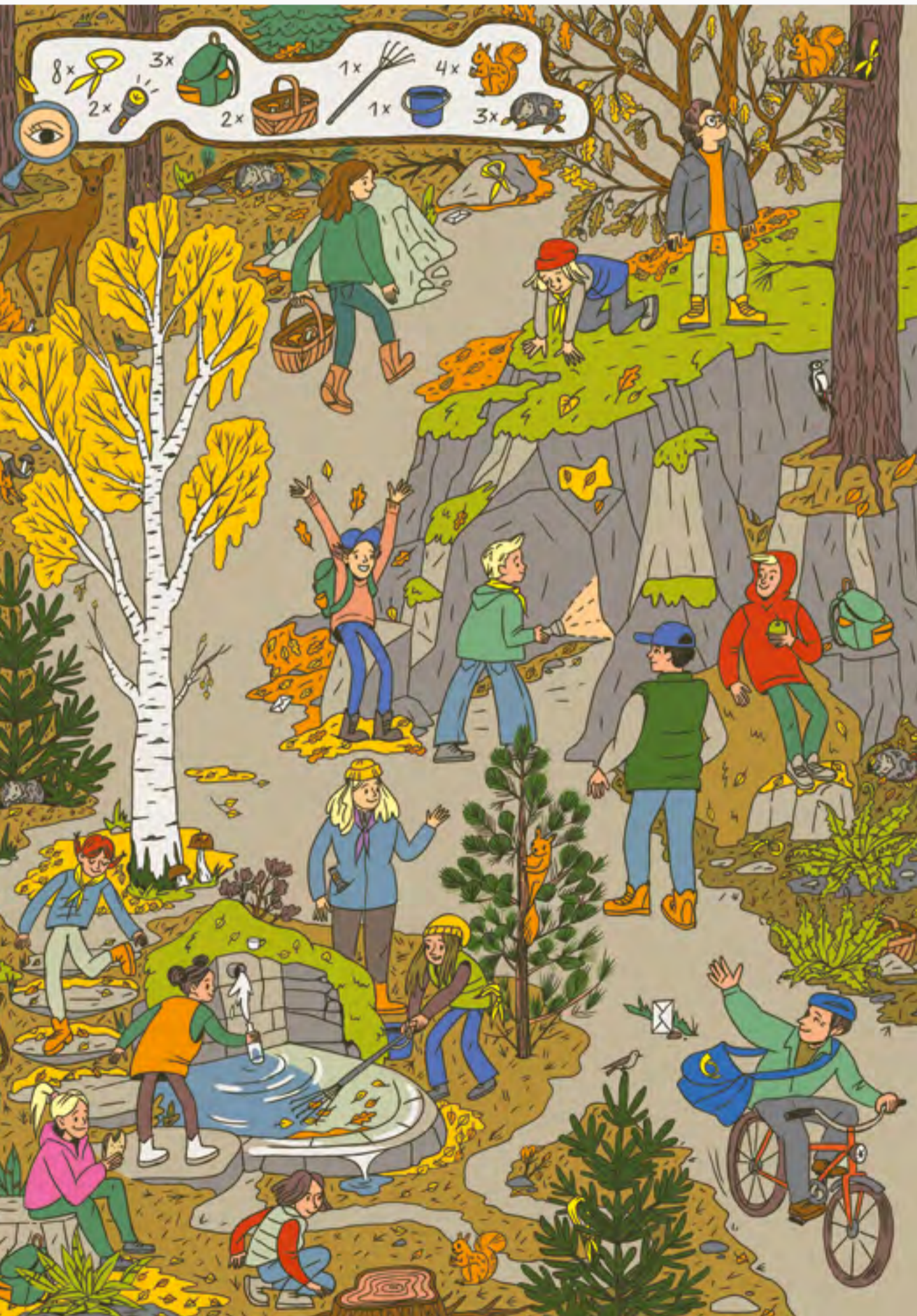
Podzim — Velká hledačka v lese! Vypátráte v barevném listí a mezi stromy všechny ukryté věci? Najděte v lese stejné stromy, jako jsou na obrázku?

• 4. 10. sv. František • 17. 11. sv. Alžběta