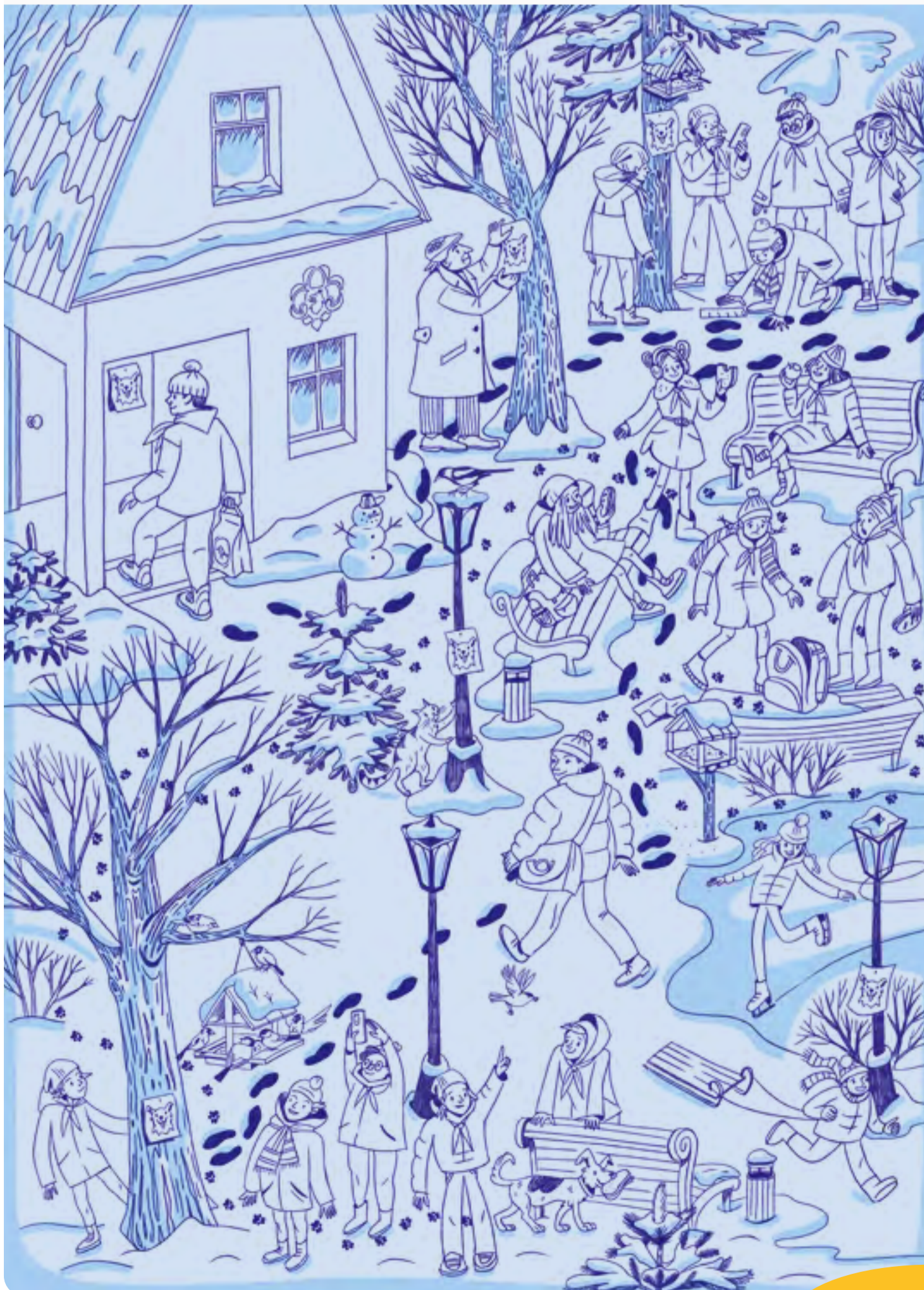
Zima — Detektivní pátrání v parku! Zjistíte, kdo plní krmítka pro ptáčky a kam se poděla světluščina svačina? Či stopy najdete v okolí své klubovny?