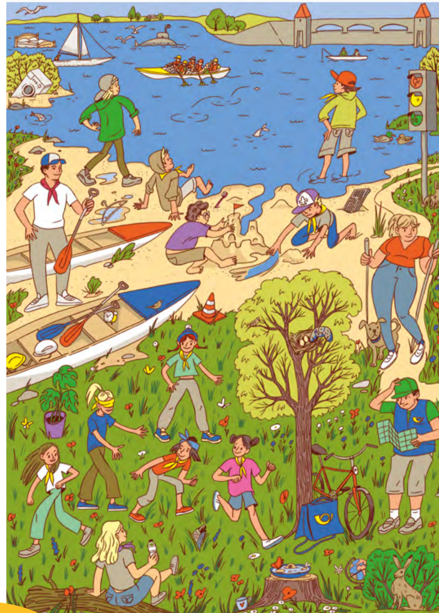
Jaro — Výprava k přehradě! Najdete všech 15 věcí, které do přírody nepatří? Víte proč? Taký jste je v přírodě potkali?