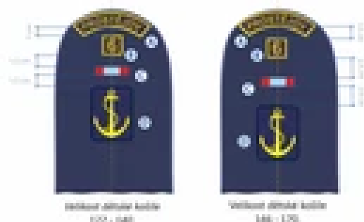
Věková úroveň 127 - 140