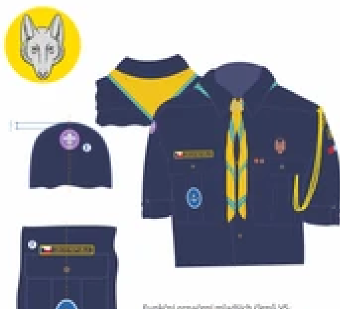
Funkční označení mláďáků (Děm) VS.