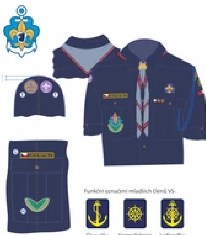
Funkční označení mláďáků (Děm) VS.