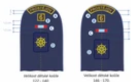
Velikostní skupina 127 - 140