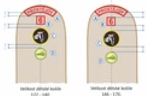
Velikost úhledná kůže 127 - 140