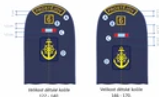
Věková úroveň 127 - 140