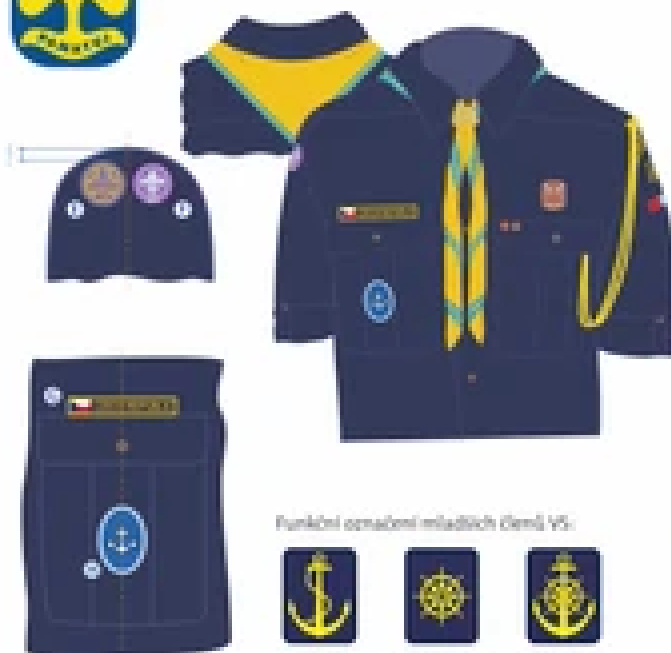
Funkční označení mladších členů VS