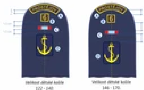
Velikost úhledná kůže 127 - 140