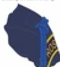
Detail funkčního oděvu