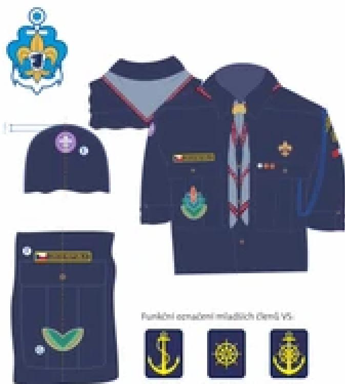
Funkční označení mladších členů VS: