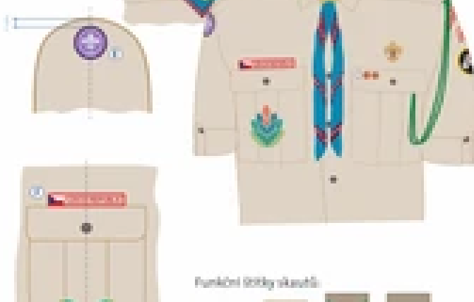
Funkční štítky skautů