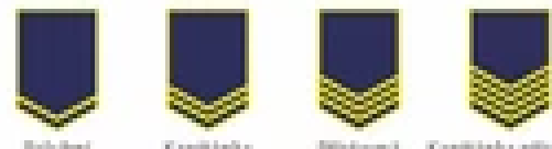
Páhubní Kapitánka Přítavná Kapitánka přítavná