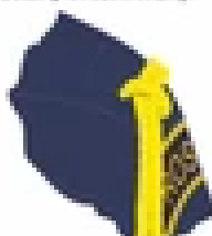
Funkční Mláčky (Děm)